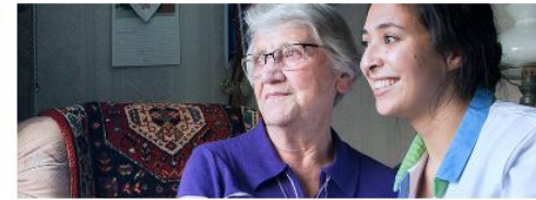
Video's: zelfmanagement en gezondheidsvaardigheden