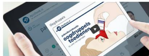
Instructievideo's over medicijnen