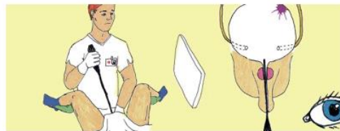
Video's over urologische problematiek